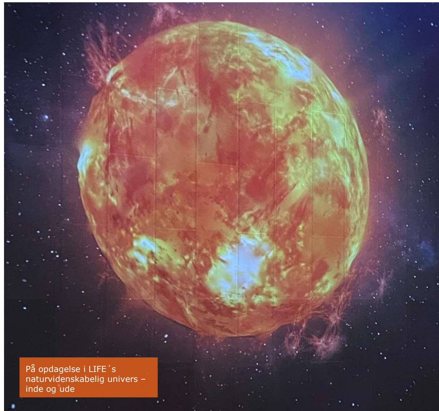
På opdagelse i LIFE´s naturvidenskabelig univers – inde og ude